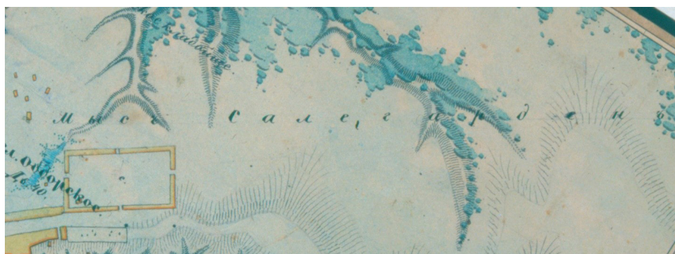
Рисунок 2. Фрагмент плана города Обдорска

Для проверки и выяснения точного ненецкого наименования места, где расположен Салехард, были проведены поиски информации в различных архивных организациях, в т.ч. в Российском государственном военно-историческом архиве. В результате обнаружен План города Обдорска снятый инструментально топографом 2 класса Сониным в 1850 году [31]. Фрагмент карты, ввиду ее большого размера, представлен ограниченно на рисунке 2.