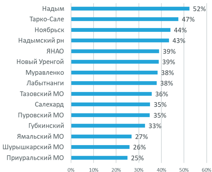
Рис. 2. Процент респондентов, желающих уехать из своего населенного пункта в течение 5 лет

Значительная часть молодежи во всех муниципальных образованиях желает уехать ранее чем через 5 лет – 29% (в основном это молодежь до 18 лет), еще 10% хотят уехать через 5 лет, 16% останутся в ЯНАО до пенсии (в основном это респонденты старше 35 лет) и лишь 12% хотят остаться здесь навсегда. Всего 43% респондентов желают, чтобы их дети оставались жить и работать в их населенных пунктах (рис. 3).